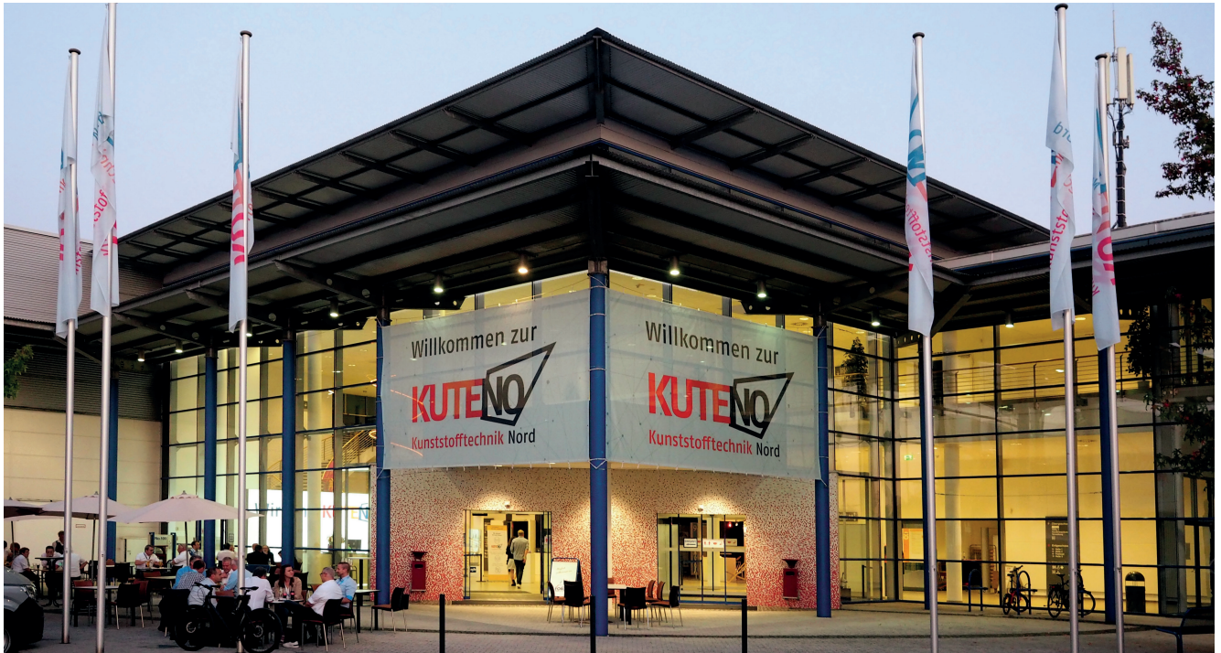
Das A2 Forum liegt in Rheda-Wiedenbrück inmitten von zwölf Clustern der kunststoffverarbeitenden Industrie.

Rund 250 Aussteller aus der gesamten Wertschöpfungskette der kunststoffverarbeitenden Industrie präsentieren sich im Mai auf der Kuteno. Das Konzept der Regionalmesse mit standardisierten Messeständen, einer großzügigen Raumaufteilung in den vier Hallen und „Meat+Eat-Stationen“ hat sich bewährt.